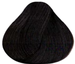
5.1 Castaño Claro Cenizo