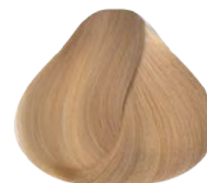
10 Rubio extra Claro