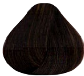
5.3 Castaño Claro Dorado