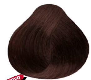
6.31 Rubio Oscuro Dorado Cenizo