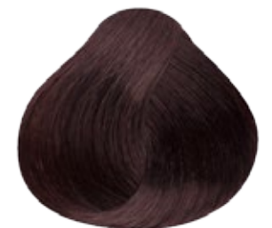
6.12 Rubio Oscuro Cenizo Nacarado