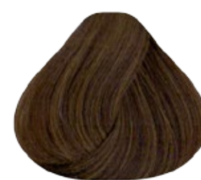
6 Rubio Oscuro