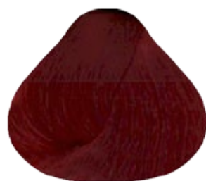
6.66 Rubio Oscuro Rojizo Intenso