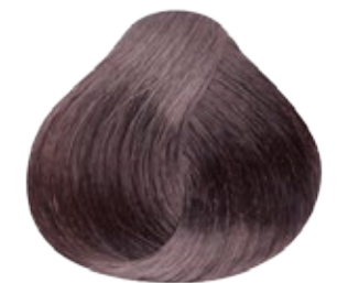
7.12 Rubio Medio Cenizo Nacarado