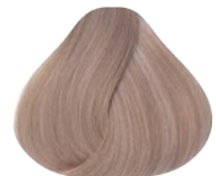
10.32 Rubio Extra Claro Platino Dorado Nacarado