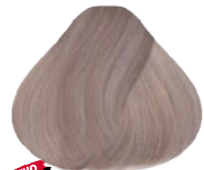
12.11 Rubio Especial Cenizo Intenso