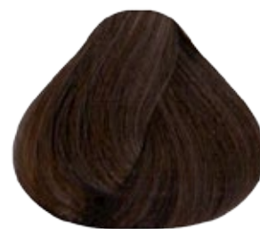
5.31 Castaño Claro Dorado Cenizo