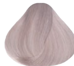
10.01 Rubio Extra Claro Platino Cenizo