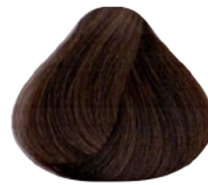
8.9 Rubio Claro Marrón