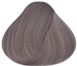
9.22 Rubio Muy Claro Perlado Intenso