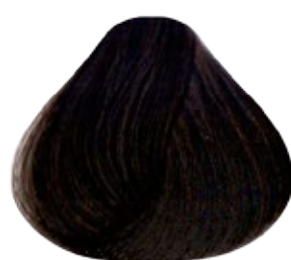
4 Castaño Medio