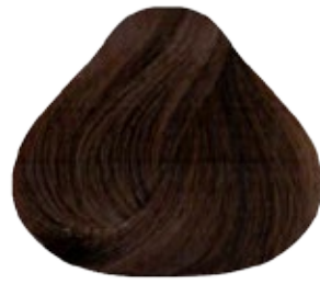
6.91 Rubio Oscuro Marrón Cenizo