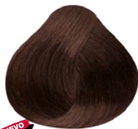
6.13 Rubio Oscuro Cenizo Dorado