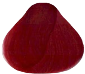
8.66 Rubio Claro Rojizo Intenso