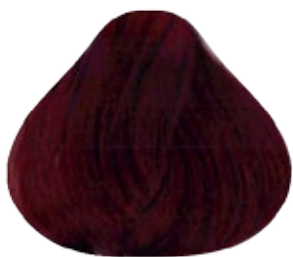
5.66 Castaño Claro Rojizo Intenso