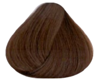
8.93 Rubio Claro Marrón Dorado