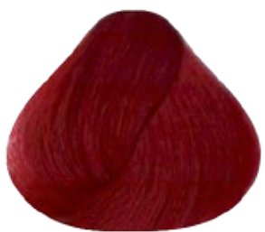
7.66 Rubio Medio Rojizo Intenso