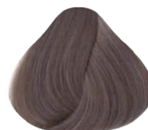
911 Rubio muy Claro Platino Cenizo