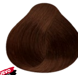
7.32 Rubio Medio Dorado Nacarado