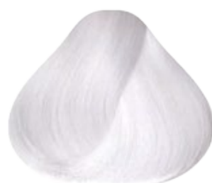
000 Reforzador de Aclarante