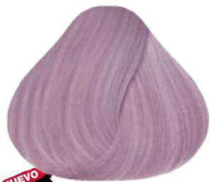
10.12 Rubio Extra Claro Iridiscente