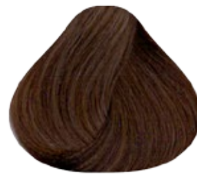
7.3 Rubio Medio Dorado