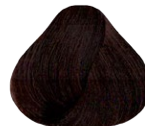
5.5 Castaño Claro Caoba