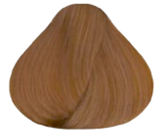
9.3 Rubio muy Claro Dorado