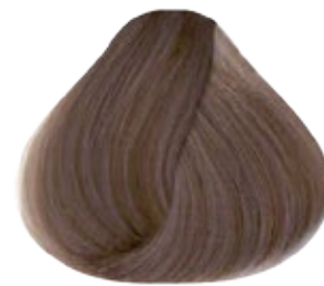
9.1 Rubio muy Claro Cenizo