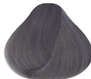
9.9 Rubio muy Claro Platino