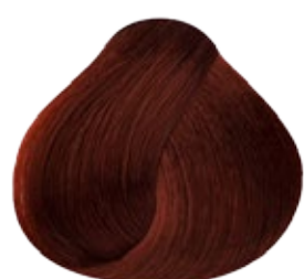
7.44 Rubio Medio Cobrizo Intenso