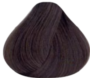
7.1 Rubio Medio Cenizo