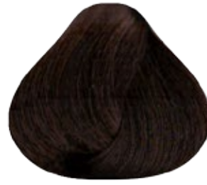
7.9 Rubio Medio Marrón