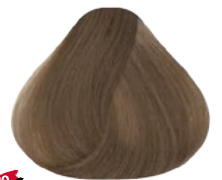
9.13 Rubio muy Claro Cenizo Dorado