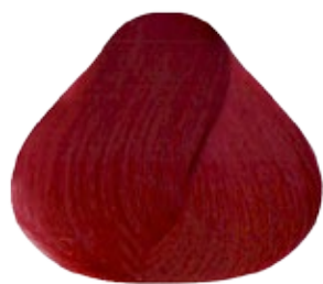
R-66 Rojo Puro Intenso