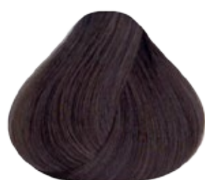
7.11 Rubio Medio Cenizo Intenso