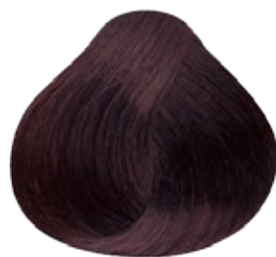
5.12 Castaño Claro Cenizo Nacarado