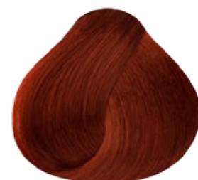
8.34 Rubio Claro Dorado Cobrizo