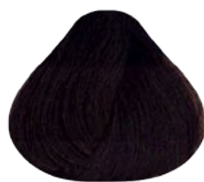
3 Castaño Oscuro