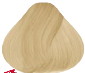
10.3 Rubio Extra Claro Dorado