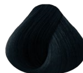
2.1 Negro Azulado