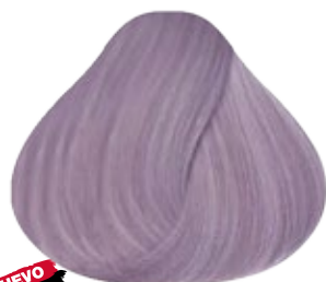
12.21 Rubio Especial Perlado Cenizo