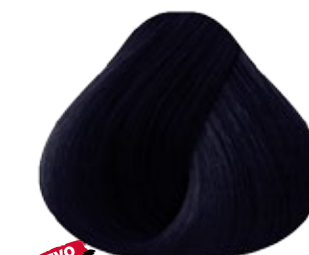
NUEVO TONO 2.2 Negro Violeta