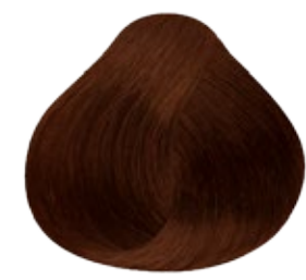
7.35 Rubio Medio Dorado Caoba