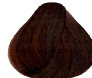
6.53 Rubio Oscuro Caoba Dorado