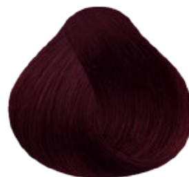
4.26 Castaño Medio Nacarado Rojizo