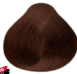
7.31 Rubio Medio Dorado Cenizo