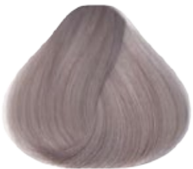
10.21 Rubio Extra Claro Perlado Cenizo