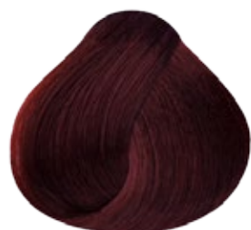
6.45 Rubio Oscuro Cobrizo Caoba