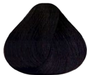
6.1 Rubio Oscuro Cenizo