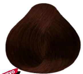
6.51 Rubio Oscuro Caoba Cenizo