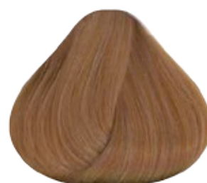
9 Rubio muy Claro