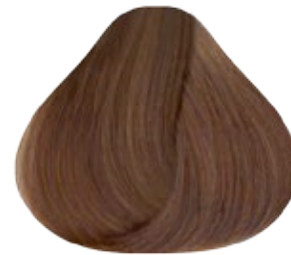
8.3 Rubio Claro Dorado