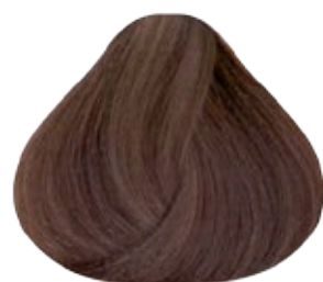
7 Rubio Medio