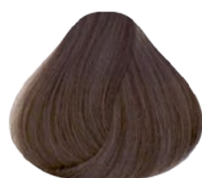
8 Rubio Claro