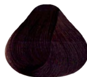
5.35 Castaño Claro Dorado Caoba