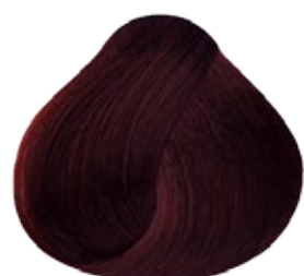
4.45 Castaño Medio Cobrizo Caoba