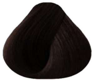
5.9 Castaño Claro Marrón