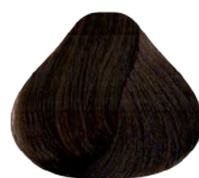
5 Castaño Claro