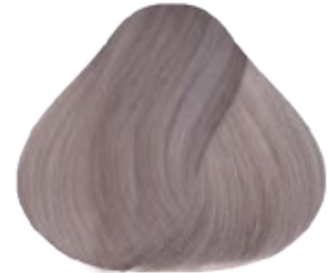
10.22 Rubio Extra Claro Perlado Intenso